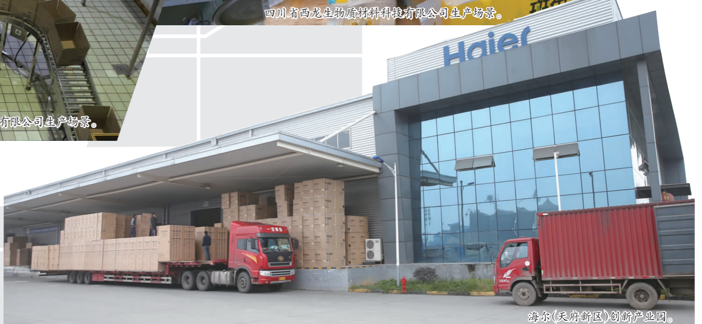
海尔(天府新区)创新产业园。