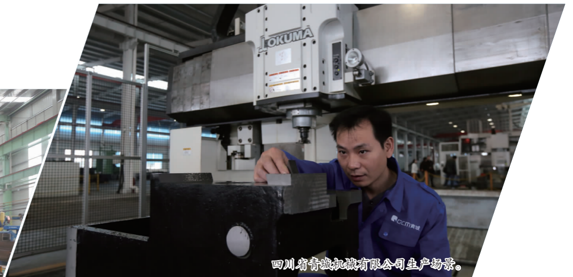
四川省青城机械有限公司生产场景。