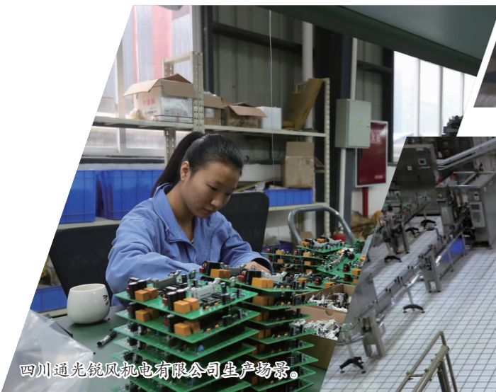
四川通光锐风电有限公司生产场景。