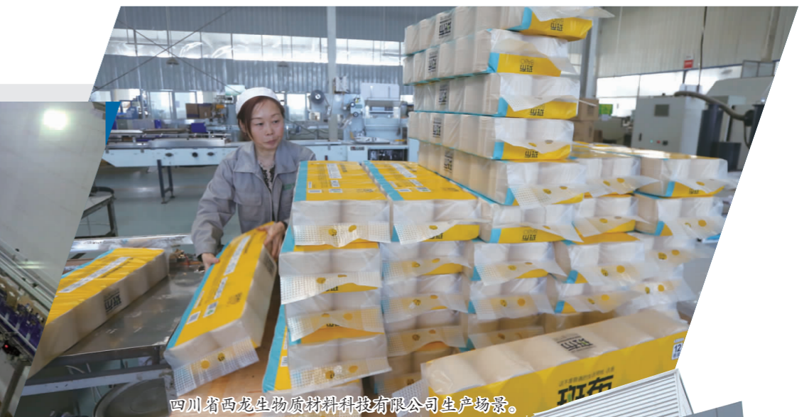
四川省西龙生物新材料科技有限公司生产场景。