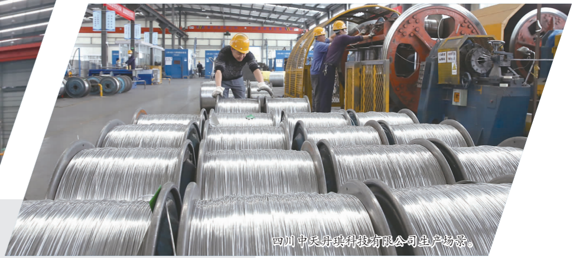
四川中天开瑞科技有限公司生产场景。

今年以来,面对新常态,在工业企业普遍遭遇困难的当下,我市工业企业克服重重困难,加快发展、创新发展,并取得不错的成绩:今年前10个月,规模以上企业工业总产值达1162.2亿元,工业增加值增长12%,高于全省平均水平4.1个百分点,居全省第4位,工业对全市GDP贡献率突破60%,拉动全市GDP增长6个百分点以上,引领全市经济实现平稳较快增长。而去年规模以上企业工业增加值的增长为10.2%,居全省第8位。