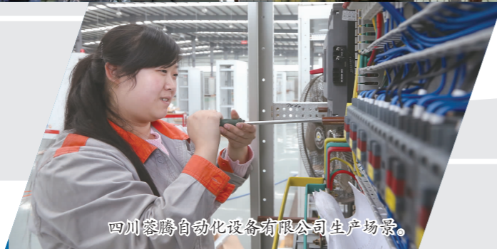
四川蓉腾自动化设备有限公司生产场景。