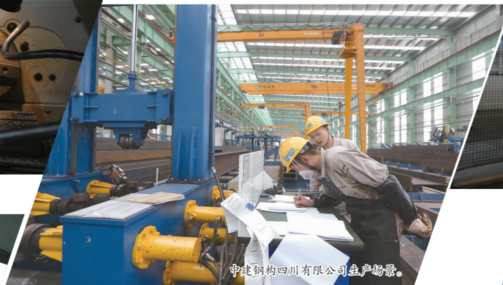
中建钢构四川有限公司生产场景。