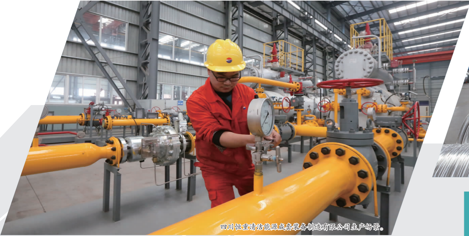
四川恒重清洁能源成套装备制造有限公司生产场景。