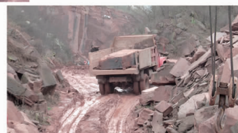
丹棱石雕工序繁多。