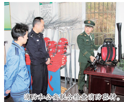
消防和公安联合检查消防器械。