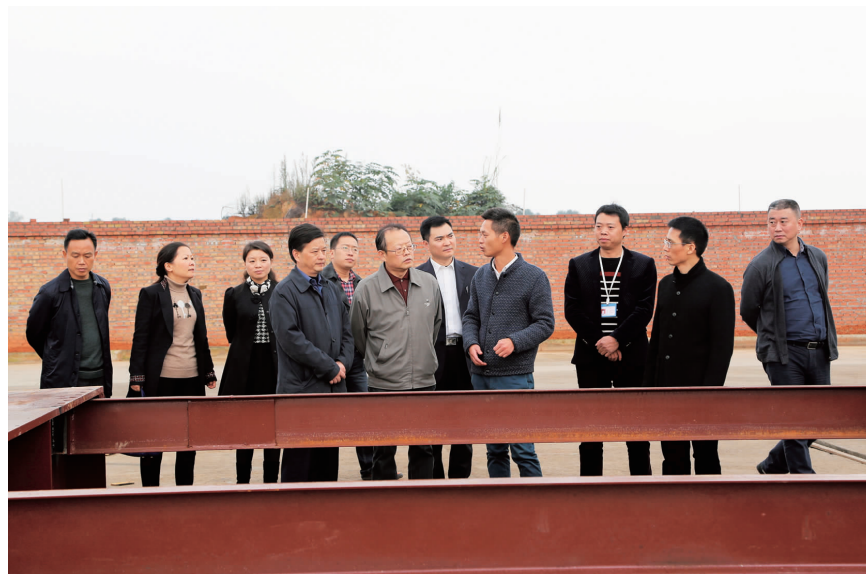
代表们与企业负责人亲切交谈,详细了解企业投资、产品等情况。

本报讯(记者 张成峰 李泓莹 王影聪、吕皓等部分市人大代表莅丹)11月17日,市领导、市人大代表