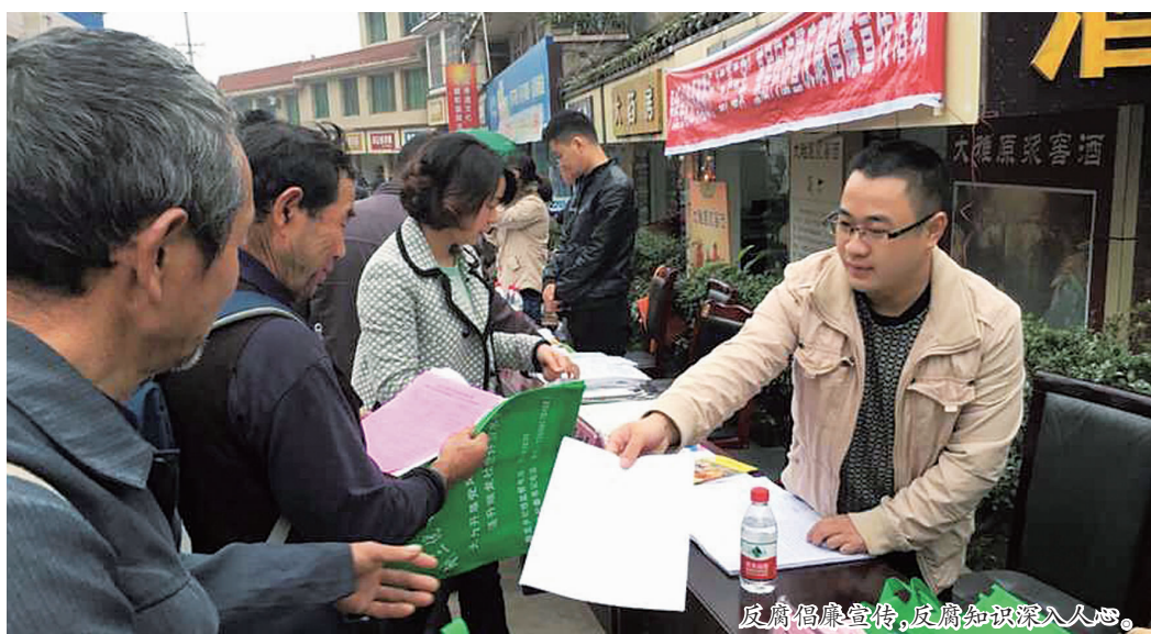
反腐倡廉宣传,反腐知识深入人心。

面对交流更便捷、直观,宣传形式贴近群众、贴近生活,采用群众喜闻乐见的方式进行宣讲,让反腐倡廉知识更加深入人心。据悉,今年以来,丹棱县纪委已多次利用赶集日在7个乡镇摆摊设点,面对面听取群众对纪检监察干部履职和作风建设方面的意见建议。同时,发放印有举报电话的环保袋,进一步畅通了乡村信访监督举报渠道,进一步维护了当地群众的合法权益和利益诉求。