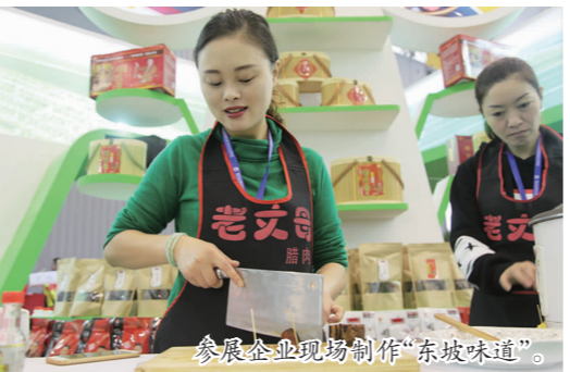
参展企业现场制作“东坡味道”。