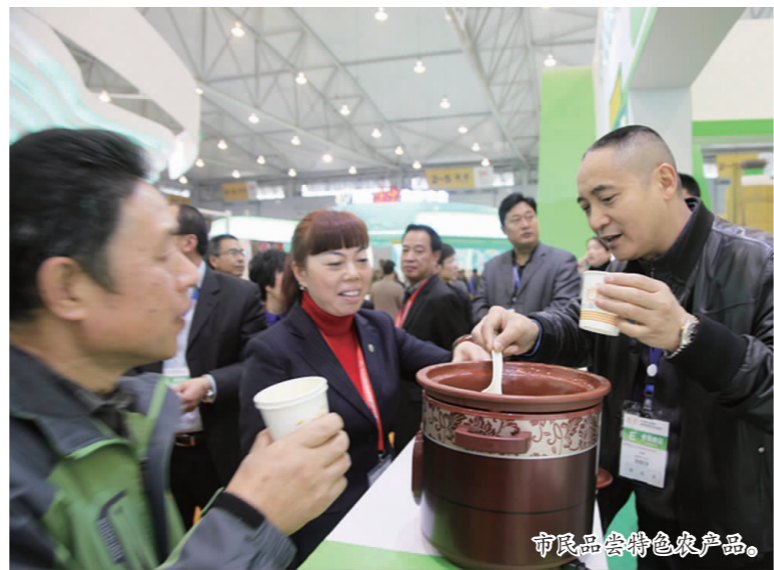
市民品尝特色农产品。

客奉茶,并悉心指导大家右手持杯、左手托起杯底,观茶色、闻茶香、品茶味,三口品下,再回喉。据介绍,此次洪雅绿茶馆以“洪雅绿茶,韵香千年”为主题,通过展示销售洪雅县为重点的绿茶、红茶、白茶、黑茶等绿色、生态、有机茶叶,展示洪雅县都市近郊型现代农业“农旅”相融发展取得的突出成效。此次茶叶展销会,洪雅馆总共组织16家茶叶企业等新型农业经营主体参展,通过生态茶产品、茶艺表演等,充分展示洪雅县的茶产业。