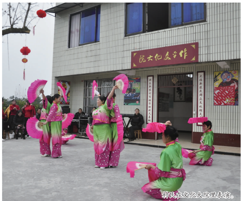
村民在文化院坝里表演。

群众自办文化院坝,鼓励引导群众通过筹资、投劳等多种形式,参与文化院坝建设;企业领办文化院坝,鼓励企业将内部文化场所向社会开放,开展“百企联百院”活动,赞助农村文化院坝建设;文旅结合办文化院坝,利用文化旅游风景区、生态农业观光园和农家乐的场地和资金优势,引导业主开办文化院坝;社团参与文化院坝建设,鼓励