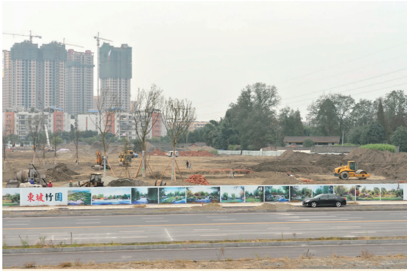
眉山岷江二桥桥头的“东坡竹园”滨江生态绿地正紧张建设中。图为10日,多台施工机械同时作业,平整场地。