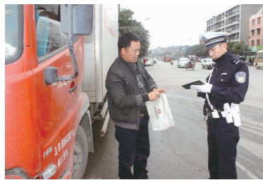
路查路检是交警执法的重要环节。