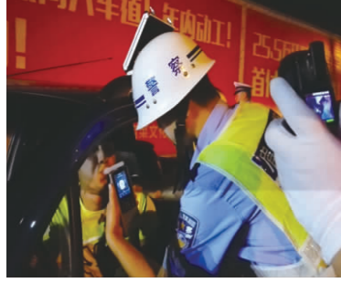
交警严厉打击酒驾毒驾等严重交通违法行为。