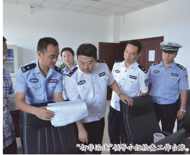
“打非治违”领导小组督查工作台账。