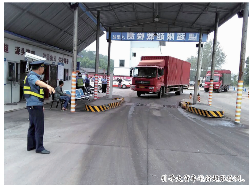
引导大货车进行超限检测。

筑。严格控制在公路两侧建筑控制区内架(埋)杆线、建厂、修养殖场以及设置广告牌、悬挂宣传横幅等。同时突出巡查实效，大队不定期监督检查，确保公路安全畅通。