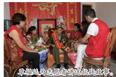
本报见习记者 肖倩 文/图

“我今天特别高兴,万万没想到会有这么多志愿者来给我祝寿,感谢党和政府对我的关心……”昨(19)日,在青神县南城镇兰沟村,来自北京、成都、眉山、乐山等地的20多位志愿者齐聚抗战老