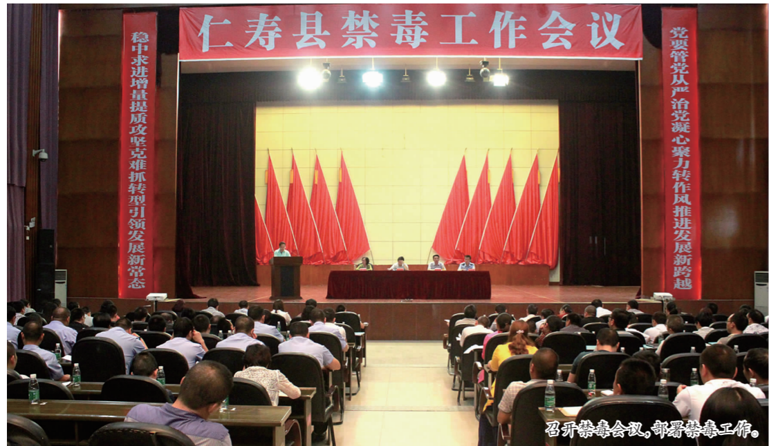
召开禁毒会议，部署禁毒工作。