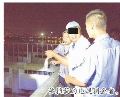
被查获的违规捕鱼者。

本报讯(刘建海 记者 古良驹 文/图)7月17日至22日,市城管执法局执法七大队联合公安、渔政等部门对东坡湖、东坡城市湿地公园周边禁渔区域展开持续夜间整治。在一周时间内,收缴渔具10余套,有效打击企图违反禁令,在禁渔区域的钓鱼者。