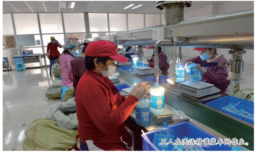
工人在洗洁精灌装车间作业。